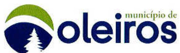
TABELA DE TAXAS, LICENÇAS E TARIFAS/PREÇOS